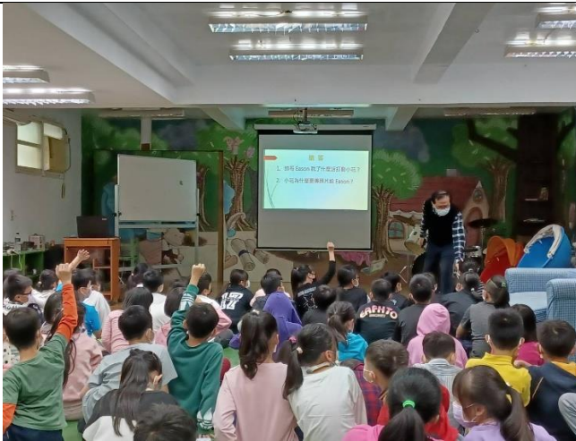
說明：中華白絲帶關懷協會到校進行宣網安導課程，學生踴躍進行問題的搶答