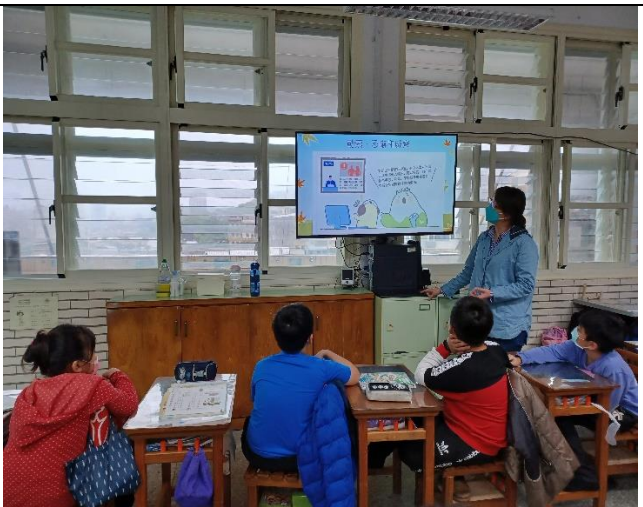
說明：各班導師生活或綜合領域課程，進行防治數位/網路性別暴力—青春不留白，隱私不散佈主題宣導