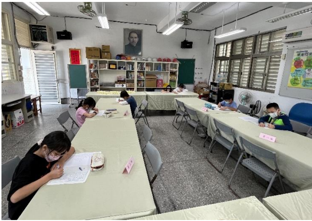
說明：校內國語文寫字競賽—性別平等教育標語